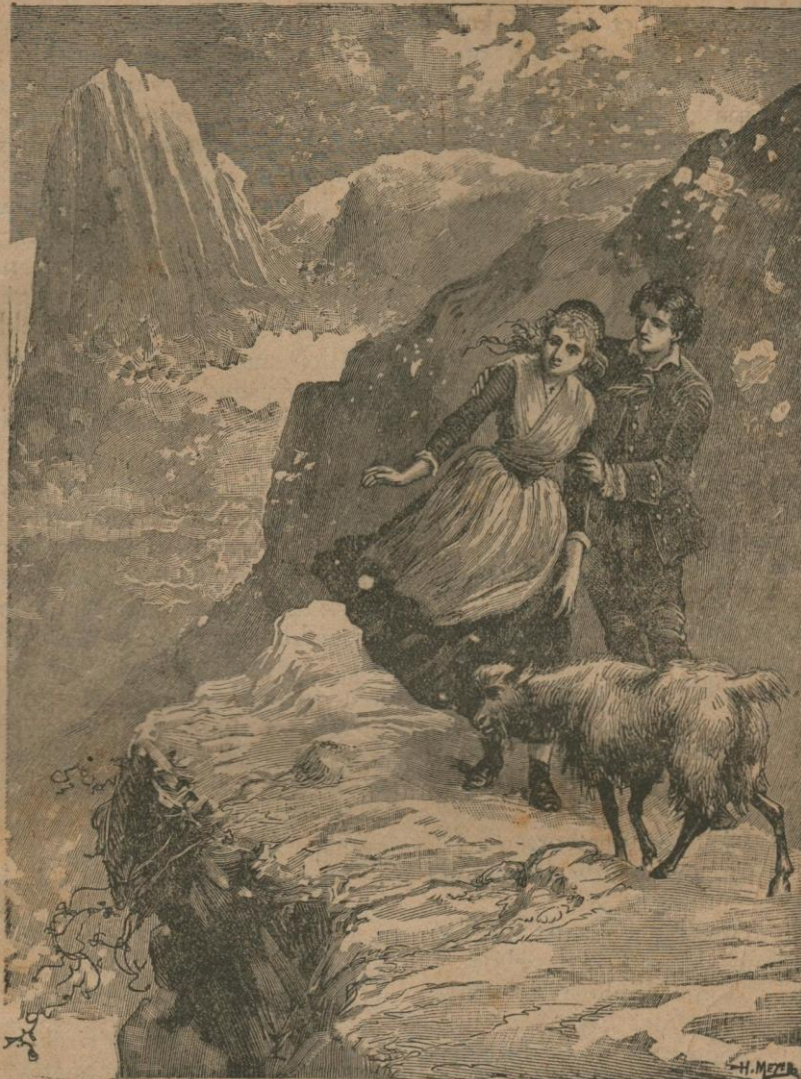
Beiden bleven onder den indruk van het grootsche tafereel.

mevrouw de markiezin bieden en haar welkom heeten in ons midden.